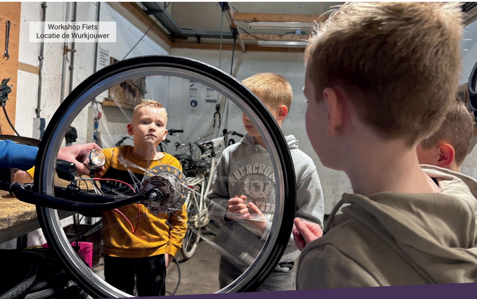
Workshop Fiets Locatie de Werkjouwer

ANBI Stichting Technolab SWF heeft als doel jongeren te enthousiasmeren voor het onderwijs in techniek, werken en ondernemen in de techniek en technologie. Technolab SWF heeft zich de afgelopen jaren gespecialiseerd in het aanbieden van workshops voor kinderen in de basisschoolleeftijd van 8-15 jaar. Daarnaast zetten we ons met aanvullende activiteiten in voor de deskundigheidsbevordering voor juffen en meesters en faciliteren we in het contact met het bedrijfsleven. We zetten daarvoor naast betaalde krachten iedereen in die een bijdrage kan leveren. Denk aan vrijwilligers, re-integratie kandidaten en andere vormen van maatschappelijke waarde.